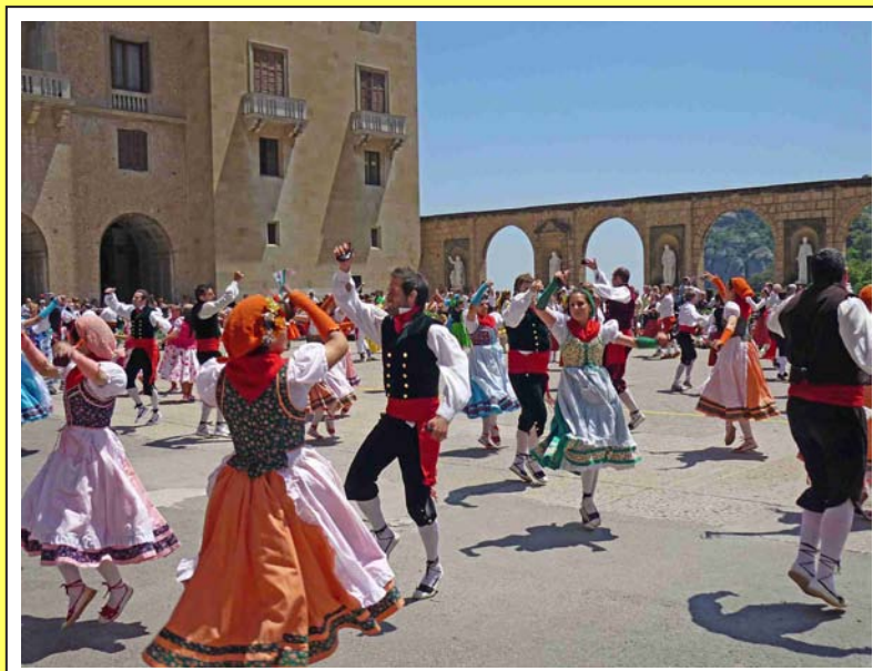
XXX Trobada de Gitanes a Montserrat. Memorial Ramón Vila