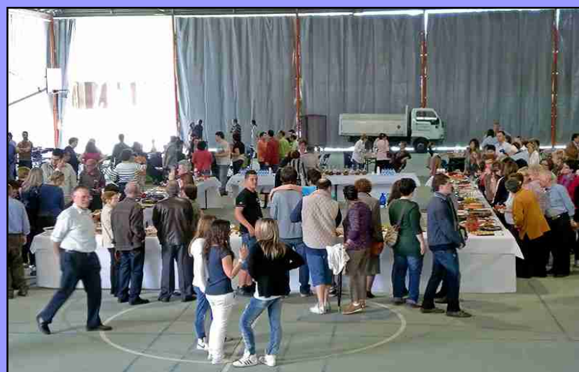
XI Mostra i degustació de cuina