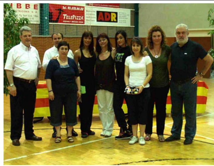
Responsables Club Gimnàstic amb les autoritats