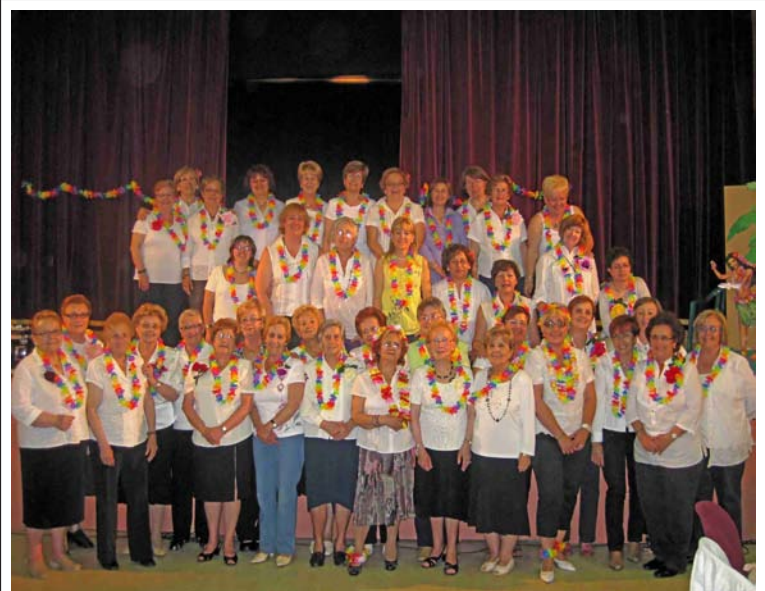
Grup de la Dona de La Unió

Grup d'Activitats per a la Dona de La Unió