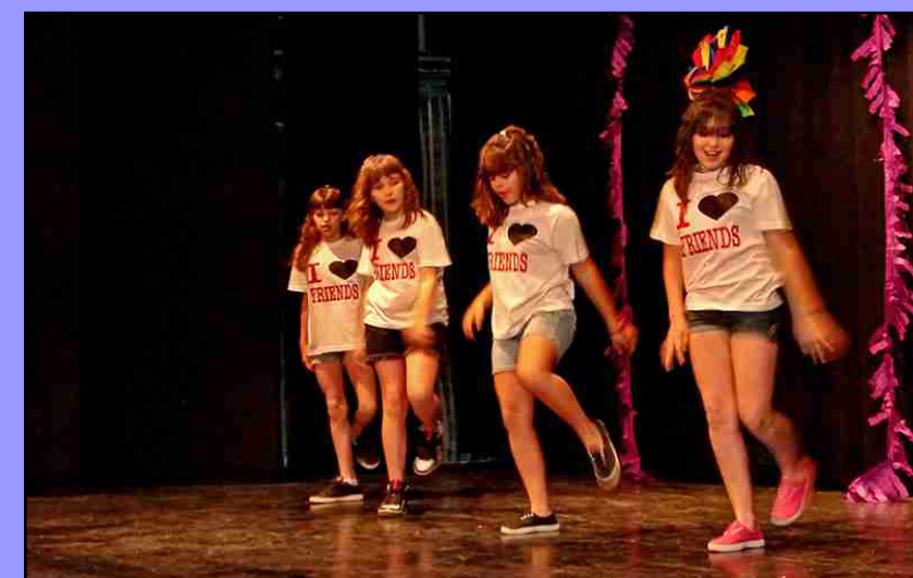
Festival de Playbacks

MAS RAMPINYO DE FESTA. UNA FESTA OBERTA I DEL POBLE