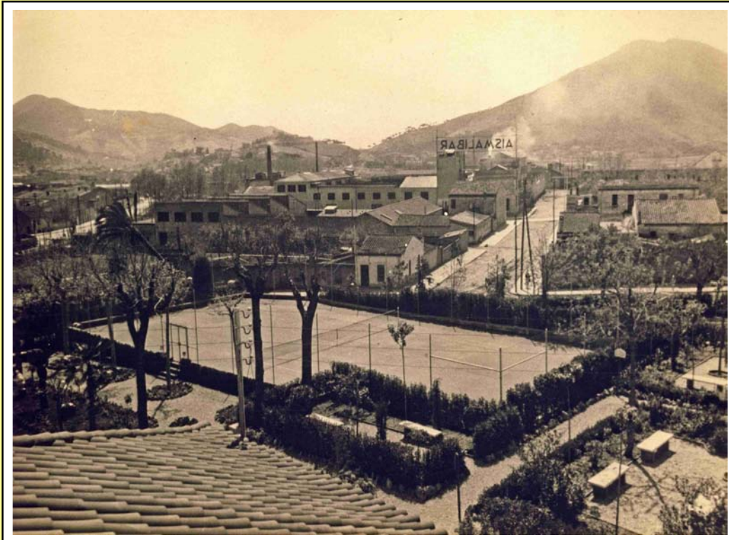
Pista de tennis del Club Aismalibar