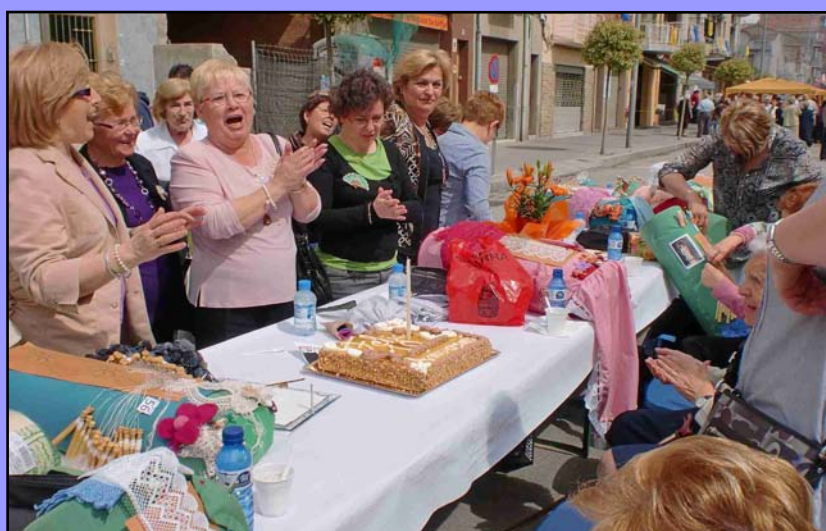
X Trobada de Puntaires