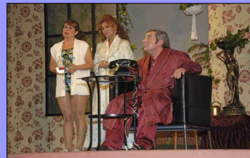
Nit de Teatre