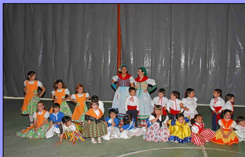
Ballada de Gitanes