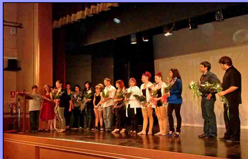
Festival de Grups