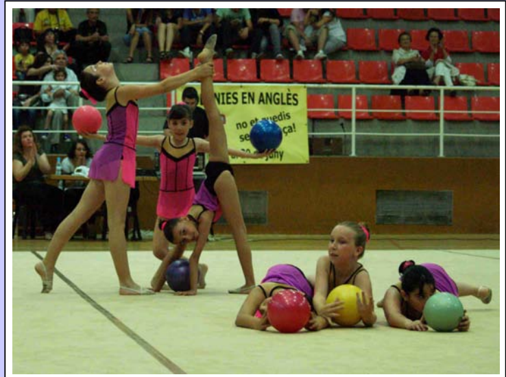
Conjunt de Pilota

Totes les exhibicions van ser de gran qualitat i la participació molt satisfactòria.